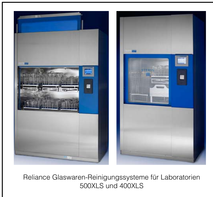
Reliance Glaswaren-Reinigungssysteme für Laboratorien 500XLS und 400XLS

Abwasserwärmerückgewinnung gewählt wurde, befinden sich das Ablassventil und der Auslass außerhalb des Reinigungssystems. Einzelheiten sind den entsprechenden technischen Zeichnungen zu entnehmen.